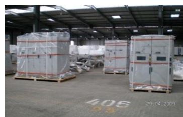
PE Folie 200 µ